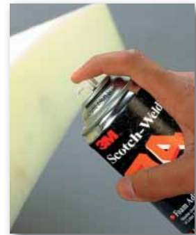
Gebruik Lijmspray 74 voor het verlijmen van schuim gebruikt bij stofferen