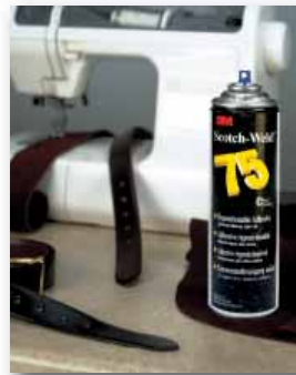
Zet emblemen en insignes vast tijdens het naaien met Lijmspray 75