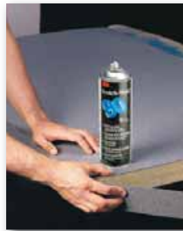
Verlijm randafwerking op tafelblad met Lijmspray 90